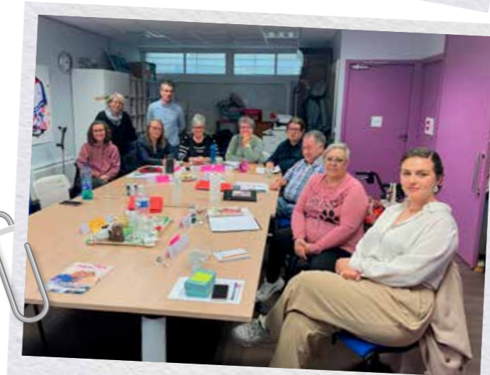
Formation APF France handicap en parler