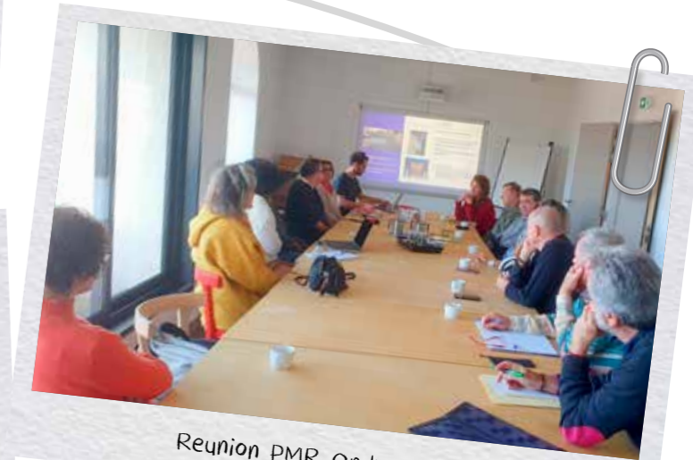
Reunion PMR Ondres 23.01.24