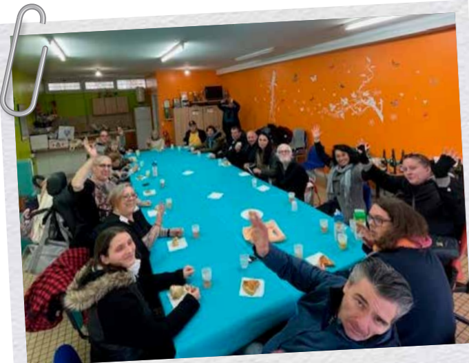
Galette des rois à Bayonne