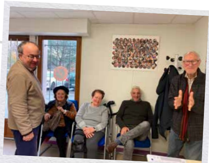
Galette des rois à Pau