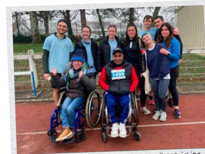
Course étudiante en partenariat avec l'association APF France handicap à Pau