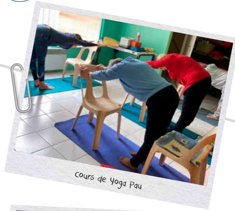
Cours de Yoga Pau